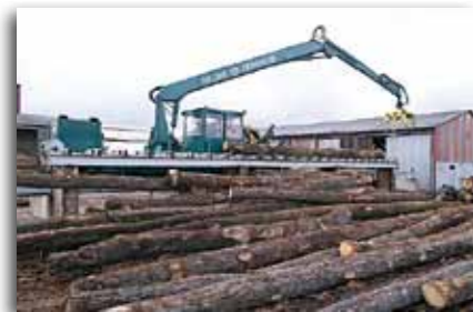
Chariot de tronçonnage.

Caractéristique qui est la garantie d'une production nationale à 99 % française.