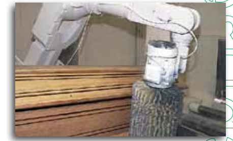
Centre usinage (à gauche). Robot de ponçage (à droite).