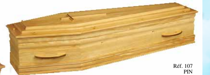
Réf. 107 PIN

98 % de cette vente est fabriquée dans nos usines à Molinet"